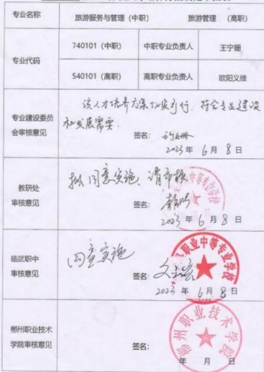
2023 级三二分段人才培养方案制定审批表