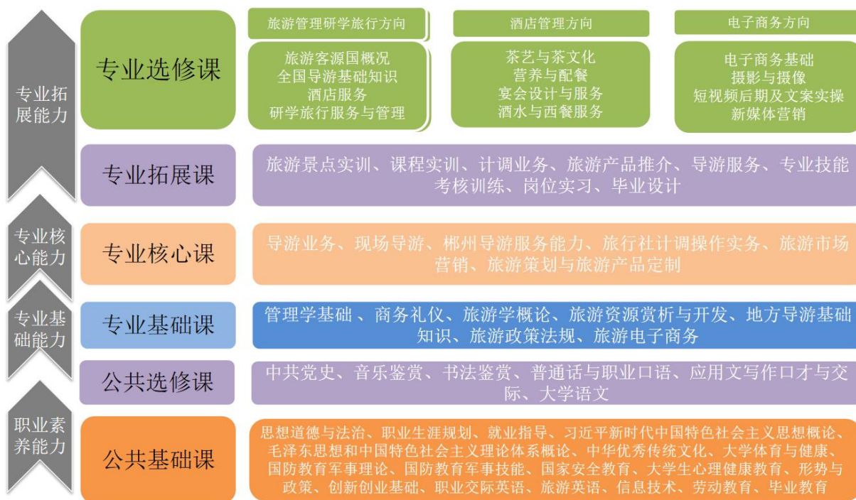
图 1 基于职业能力分析构建的课程体系